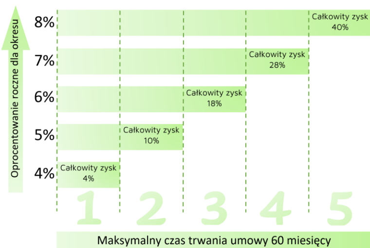
Progresja oprocentowania lokaty.

Zostań z nami 5 lat a zyskasz 40% na lokacie.